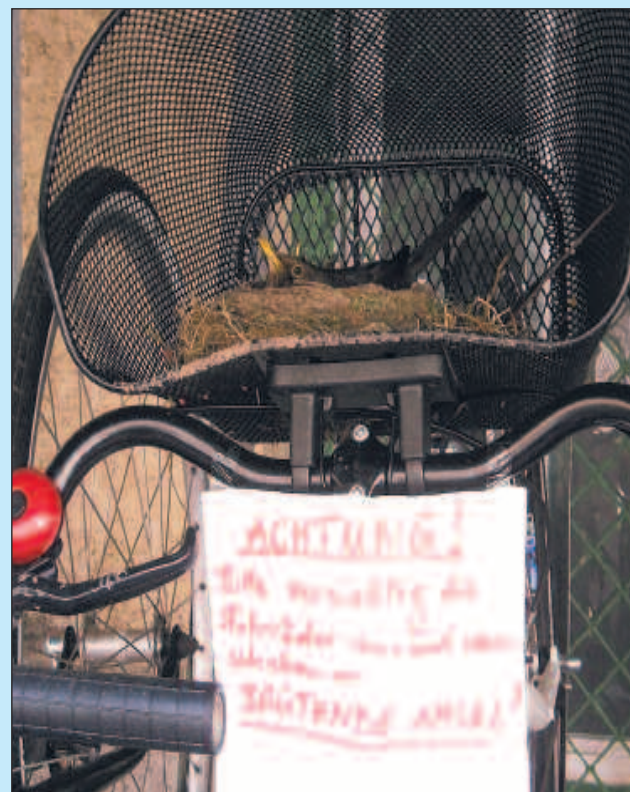
Ein Bild ungestörter Natur im Wörthhof eingenistet. Der Besitzer hat nicht nur Verständnis, sondern bittet auch andere darum.