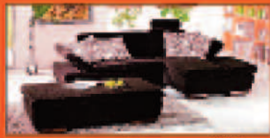
z.B. Größe 220 cm L4472 € 999,- €

VERKAUF + BERATUNG TÄGLICH 10-19 UHR. SA. 10-18 UHR.