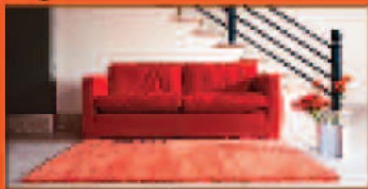
Machelle Plazette (Downy Komfort)

Markenoutlet bis -45 % Alles sofort lieferbar