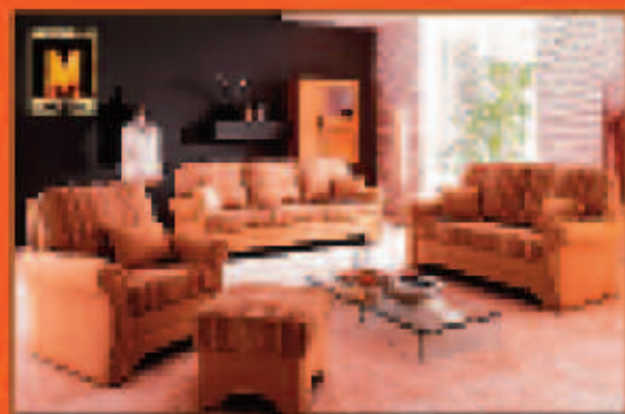
Bavaria Filmplatz, z.B. L4472 € 1.782,- €