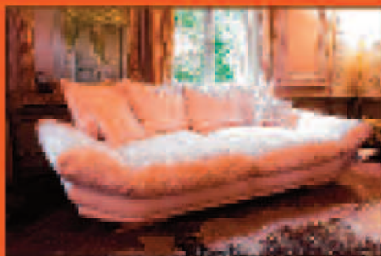
Magazin in München, L4472 € 999,- €

SITZ MÄCHER GERETSRIED-NORD Beyerwaldstraße 3-5 82538 Geretsried Tel. 0 81 71/90 93 90 www.sitzmaecher.de