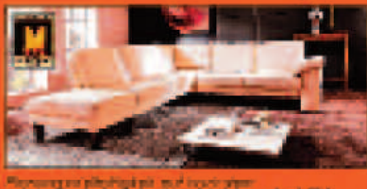
Platzangebot (plüschig) auf hochglanz Nirox im Alu, L4472 € 3.472,- €